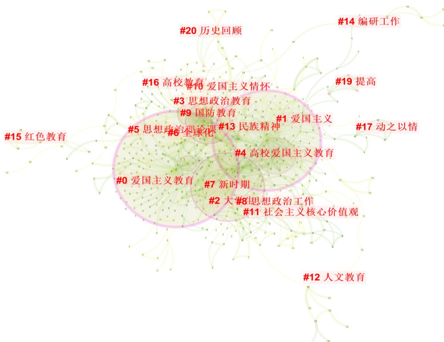
图2 高校爱国主义教育关键词聚类图谱

(1)爱国主义教育,以爱国主义教育为核心聚类,其关键词有爱国主义、高校爱国主义教育、爱国主义情怀、高校教育、国防教育、民族精神、人文教育等。该聚类主要研究了爱国主义教育的理论基础,从思想源—马克思列宁主义、历史源—“四史”、实践源—中国青少年的爱国实践三个方面进行阐述,基于地域特征分析了高校爱国主义教育的侧重点,进而提出爱国主义教育的途径,可通过课堂教学、大学生社会实践活动、校园文化建设、加强人文