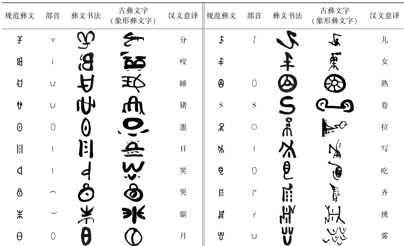
表 1 规范彝文、彝文书法和古彝文字的形式对应表

从表 1 中也可以看出,彝文书法的形式美很少受外界书法艺术的影响,一直保持彝族先民创造文字的睿智和情感,进而成为一门独有的书法艺术。