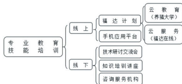
图1 新希望集团针对贫困养殖户的教育培训体系

在我国,绝大多数贫困者属于传统的体力劳动型,受教育程度低,而技术含量高的行业又需要劳动者具备专业知识。因此,贫困者因缺乏相关知识,难以在行业中发展,陷入无权的困境。扶贫先扶智,教育是减轻贫困、发展个体的最有效途径。近几年来新希望集团利用多种渠道,对养殖户开展了形式多样、内容丰富的教育培训(图1)。