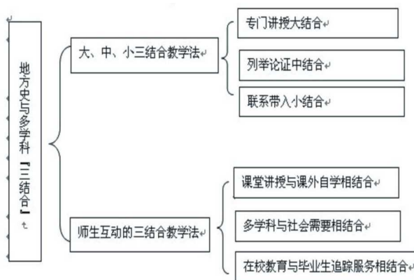
图2 多学科与地方史“三结合”的民族地区适应性人才培养模式示意图

经多年实践,《四川地方史》不仅为旅游、历史、政治、区域经济、中文、法律、文科师范等专业学生提高综合素质服务,也利于教育学、农学、经济、管理、水电、畜牧、城乡规划、食品加工、建筑设计、地质地理、中医药学、交通等诸多专业的学生优化知识结构,提升专业水平,使其更好适应西部民族地区经济文化建设需要,因而受到广泛的欢迎。在当前深入贯彻落实党的十八大精神,全面建成小康社会的伟大历史时期,为全面推进五位一体建设提出的新要求,《四川地方史》课程有义不容辞的责任。课题组以学校课程改革为契机,将《“两史三结合”民族地区适应性培养模式》创新为设计《“地方史与多学科”“三结合”民族地区适应性培养模式》,并在教学中加强地方经济和生态文明建设的内容,更好地实现培养“立足凉山,服务四川,面向西南”的高素质人材目标。(见图2)。